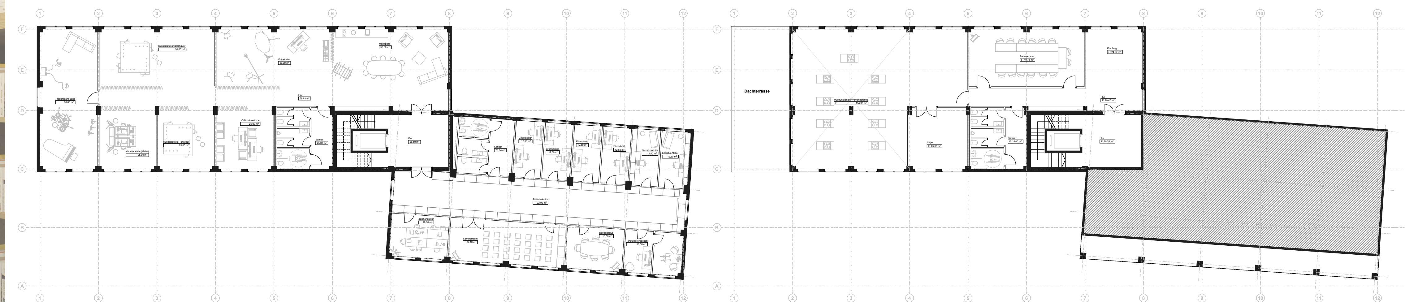
Grundriss 3. OG 1:200